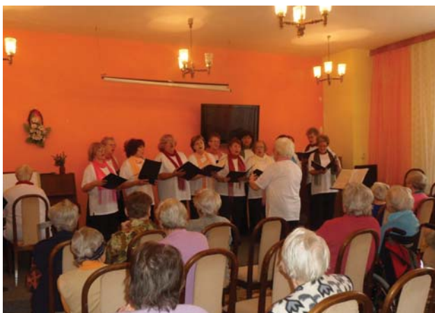
Vystoupení Sboru Seniorek