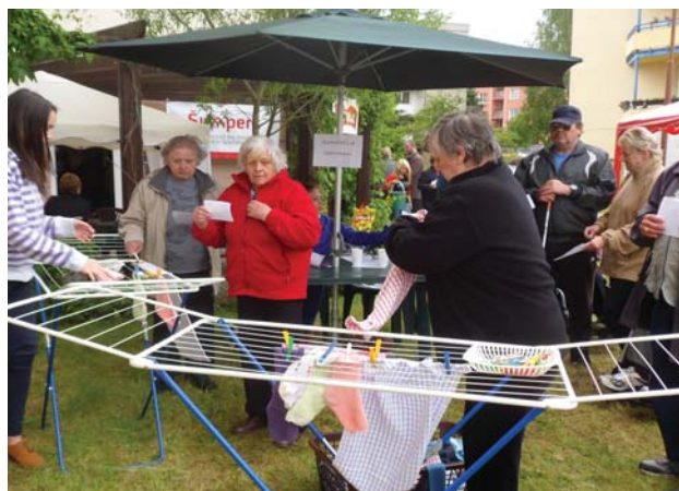
Sportovní hry PONTIS