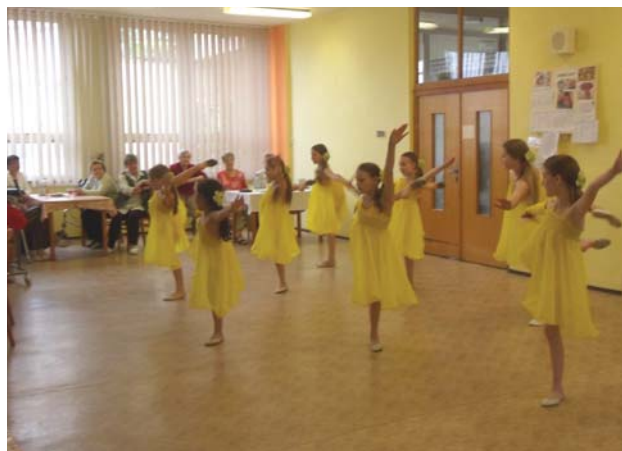
Vystoupení skupiny Tornádo